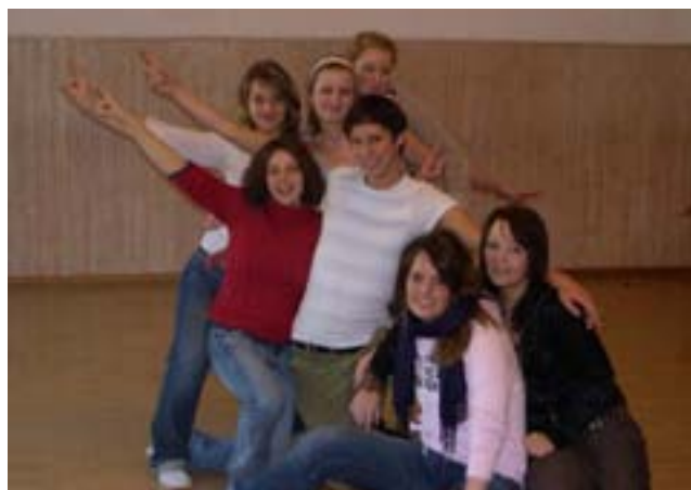
...ist die Fotopose bereits nahezu perfekt

„Oh happy Day...“ Die Abstimmung zwischen den einzelnen Stimmen fällt noch sehr schwer. Außerdem ist das erste Mal, dass diese Kombination außerhalb der heimischen Mauern zusammen singt – und nicht alle Damen sind so ganz bei der Sache. Doch schon am nächsten