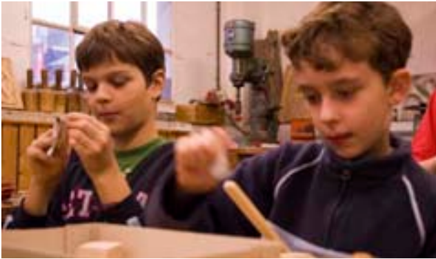
Die Frösche, Mäuse und Hampelmänner sollen eher die jüngeren Schüler und Kinder ansprechen...

Da wäre z. B. die Sache mit den Fröschen. Hä? Frösche? Genau. Nicht alles was dort hergestellt wird ist nützlich. Dafür sind die Frösche schön anzusehen. Wie wär's mit einem auf dem Weihnachtsbaum? Nein? Genau, die sind zu schwer. Außerdem wäre der Frosch wegen der grünen Tarnfarbe sowie so nicht zu sehen. Aber