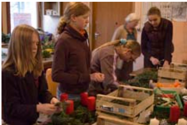
Die Schüler binden wie jedes Jahr Adventskränze zum Verkauf

Dafür, dass die Kerzen auch in diesem Jahr zur Adventszeit in stilvoller Atmosphäre brennen, sorgen die insgesamt 12 Schülerinnen und Schüler in der Gartenbau-Baracke, unterstützt von Lehrern und Eltern. Aus Tannengrün, Weidenzweigen und Moos werden Kränze gebunden,