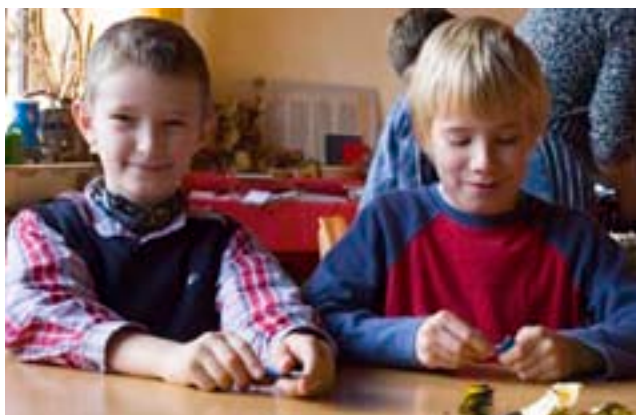
Faltsterne sind nur ein kleiner Teil der vielen verschiedenen Dinge, die in Klasse 3 hergestellt werden.