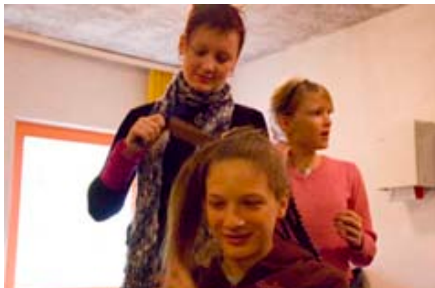
Die Frisuren werden an den Schülern getestet, damit am Adventsfest jeder Handgriff sitzt

ich mir so etwas noch nie machen“, erzählt sie. „Dafür sind immer zwei Leute nötig.“ Von den neu errungenen Frisurenkenntnissen der Schülerinnen kann man sich in Klasse 13 überzeugen.