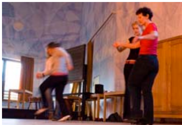
Unter Anleitung lernen die meist weiblichen Schüler die verschiedenen Tänze in recht kurzer Zeit