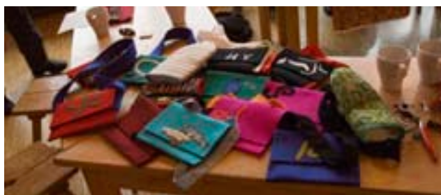
Die kleinen Handtaschen stehen heute zum Verkauf