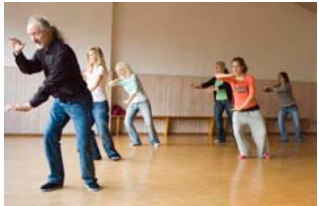
Den eurythmiegeübten Zwölftklässlerinnen fällt die asiatische Umgewöhnung zu Thai Chi nicht schwer

Der Tai Chi Lehrer ist begeistert von seiner Gruppe: „Sie haben sehr gute Fähigkeiten“. Doch er erkennt auch, dass es seinen Schülerinnen „etwas befremdlich“ vorkommt. Auch die Schülerinnen selber geben zu, dass es „cool und wirklich interessant ist“, aber sie werden es wohl fürs Erste nicht fortführen. Dann wird jedoch noch eingelenkt: „Vielleicht