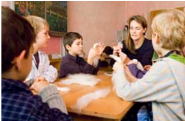
Das Arbeiten mit Wolle macht allen Erstklässern Spaß