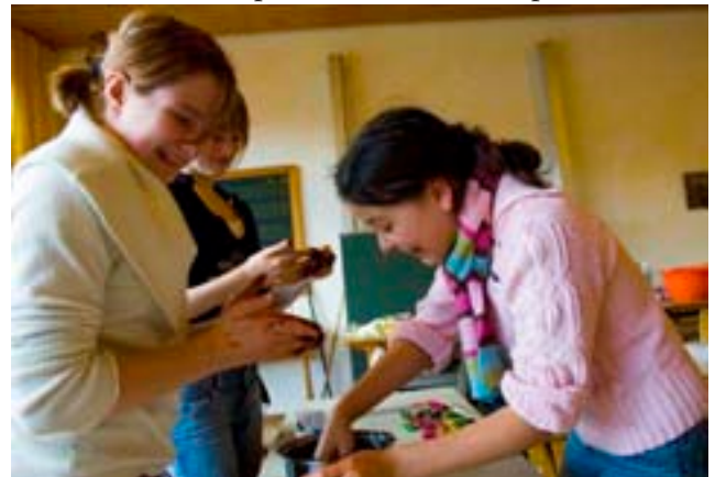
Den Projektteilnehmerinnen konnte man den Spaß an der Arbeit mit den Süßigkeiten anmerken

jedoch auf, dass auch noch etwas zum Verkauf übrig bleibt. Trotzdem durften wir auch mal probieren und können besonders das Wallnusskonfekt empfehlen.