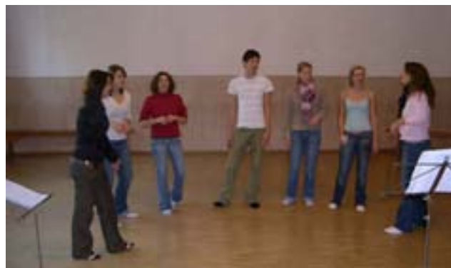
Während das Singen noch geübt wird...