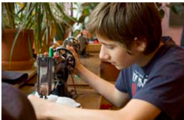
Die Herstellung von Taschen ist nicht nur eine Mädchenarbeit