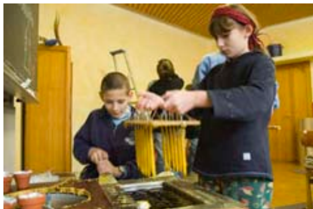
...bevor sie in das heiße Wachs getaucht werden