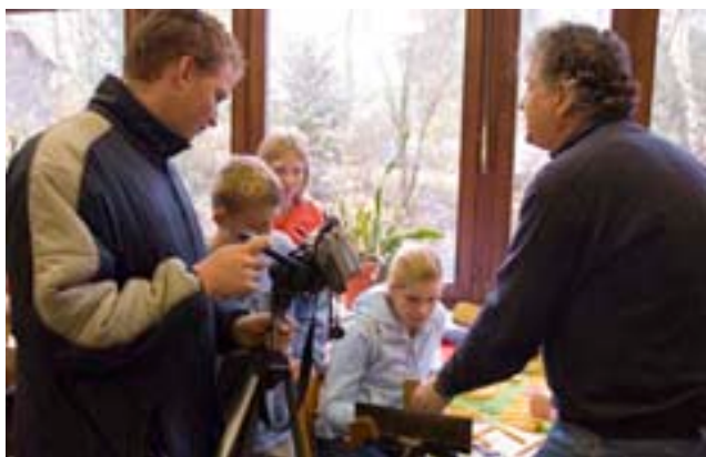
Die Kerzenziehgruppe wird in der Gegenwart des Kamerateams und der Journalisten nervös

So könnte man die Schüler nennen, die sich im Projekt „Medien“ eingetragen haben. Tief im Keller der Schule, gegenüber der Zeitungsredaktion, haben sich die acht Jungs und Mädels im Technologie-raum verschanzt. Dort wird das Material, das in zäher Interviewarbeit