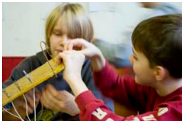
Die Dochte für die Kerzen werden an dem Brett befestigt...

500 bis 700 Kerzen pro Tag“, erklärt er. Dabei wirkt der Arbeitsprozess auf den ersten Blick, als bestünde er in erster Linie aus chaotischem Herumrennen. Die an Holzbrettern befestigten Gewichte werden in geschmolzenes Bienenwachs getaucht, müssen dann zum Trocknen