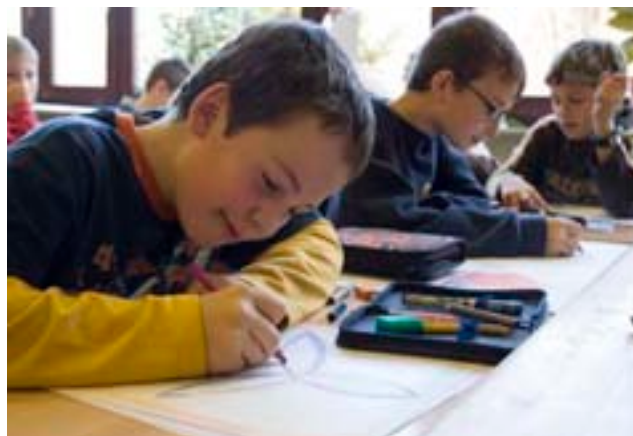
Die selbst hergestellten Kalender dürfen die Viertklässler nach der Projektwoche behalten

nicht jeder Monat mit einem Montag beginnt“, so Aron. Aber die Kinder proben nebenbei auch Musik, denn zur Eröffnungsfeier des Adventfestes treten die Viertklässler mit den Klassen 1 bis 3 auf.