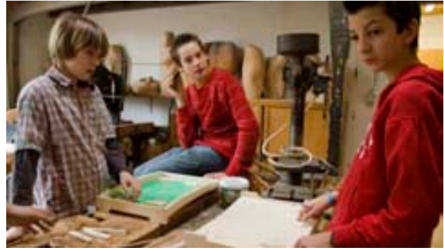
...während die Kickertische auch für die größeren ein schönes Weihnachtsgeschenk abgeben

als Weihnachtsgeschenk eignen sie sich vortrefflich. Der Beschenkte kann den Frosch nämlich hinter sich herziehen. Auch die Flipper eignen sich vortrefflich als Geschenkidee. Also, wer schon einen grünen Frosch hat, der legt sich noch einen Flipper zu. Wieso auch nicht? (Du hast noch keinen? Wie peinlich für dich!)