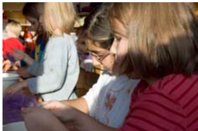
Auch in der 2. Klasse wird in der Projektwoche gefilzt

liegen schön in Reih und Glied auf einem der Tische. „Die werden dann auch beim Adventsfest verkauft“, lasse ich mir sagen.